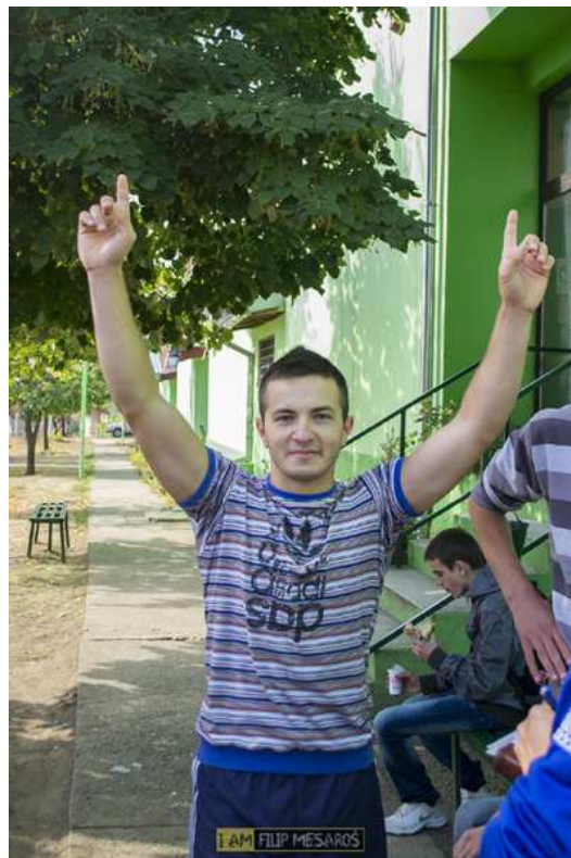
...победа и одмор